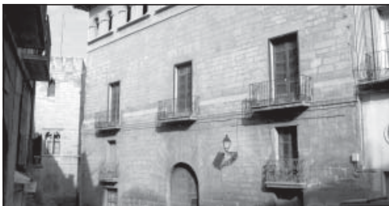
Vista parcial del Palacio Cascajares desde la Calle Mayor

El Pleno del Ayuntamiento de Alcañiz, en sesión celebrada el pasado 5 de noviembre, aprobó por unanimidad la compra del Palacio Cascajares (en el número 22 de la Calle Mayor) por un importe de 78.000.000 de ptas. (468.789,44 euros). El acta de la sesión refleja que la compra se realiza "con la intención, según acuerdo con el Convenio de colaboración firmado por Diputación General de Aragón y distintos municipios integrantes de la Comarca del Bajo Aragón, de ubicar en el citado edificio la sede de la Comarca del Bajo Aragón".