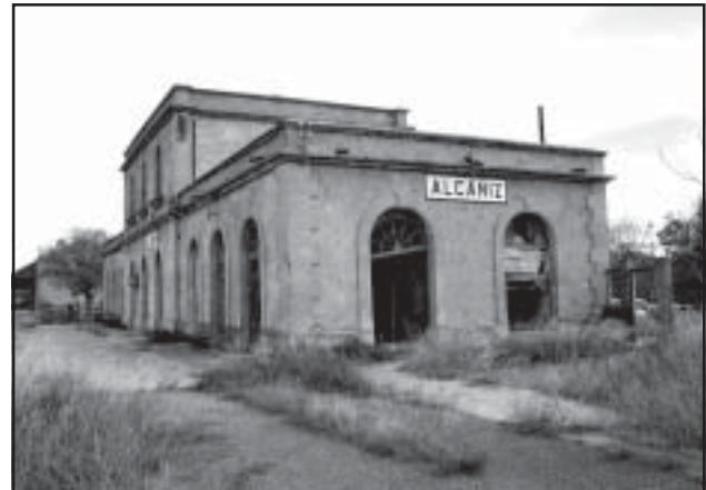
Estación de Alcañiz, hoy abandonada

parece imprescindible comparar estos datos con el sensiblemente menor tiempo, para la misma distancia, que emplea el tren de Caspe a Zaragoza, a un precio aproximado de 1.600 ptas. ida y vuelta, con la posibilidad de descuentos importantes para abonos, estudiantes, jubilados, etc.