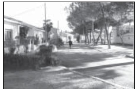
Ronda Amantes en Puigmoreno

Podemos asegurar a los habitantes de estas dos pedanías que la intención, la dedicación, el interés de nuestro partido por ellas, ha sido y es muy superior al demostrado por otras formaciones políticas. Lamentablemente siempre hay miembros dentro de una comunidad que intentan desprestigiar las actuaciones de los que realmente trabajan por ella. El Partido Aragonés seguirá luchando por la integración de estos dos barrios, por el aumento de sus servicios, y por el mantenimiento de los mismos.