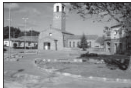
Plaza de Valmuel

les con nuevos juegos. Por fin la plaza de Vamuel será también una realidad, como lo fue la urbanización de la ronda Amantes en Puigmoreno. Hemos conseguido que se haga la torre y el cerrado del repetidor de televisión, que se arreglen los relojes de las torres, y que haya un peón municipal dedicado a las tareas de mantenimiento que sus Alcaldes le encomienden. Hemos intercedido además para que asuntos que no dependen del municipio se aborden con urgencia.