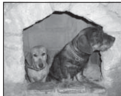
La tenencia de animales, regulada

dece la colaboración de todos los que han participado en su elaboración y hace una enumeración de las alegaciones o sugerencias presentadas por CEPYME, TRADIA, Confederación Hidrográfica del Ebro y la Comisión Provincial de Ordenación del Territorio, agradeciendo la colaboración que al efecto suponen tales alegaciones o sugerencias. Destaca la dificultad de la materia regulada, por la cambiante normativa al respecto, destacando, a título de ejemplo el Real Decreto 1066/2001, sobre Protección del Dominio Público Radioeléctrico, la Ley 19/2001, sobre Tráfico o la Ley 3/2001, en materia de Drogodependencias, ésta de la Comunidad Autónoma de Aragón. El Sr. Marco sugiere que se de cumplida publicidad con remisión a los afectados de copia de la parte correspondiente (Bares, constructores, etc.), a fin de que sepan qué hacer antes de promover la sanción correspondiente y