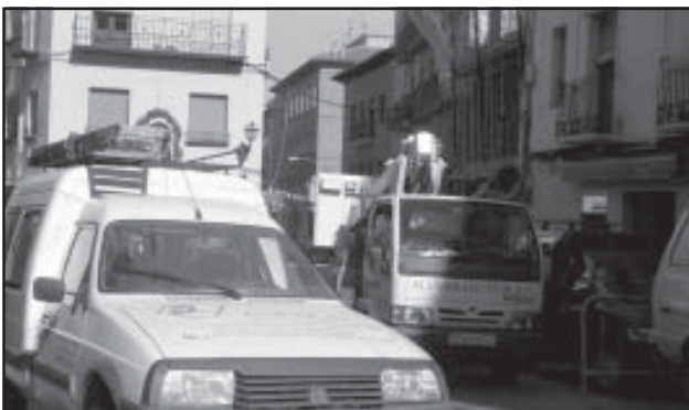
Atasco circulatorio en la Plaza de Mendizábal

- Los semáforos no tienen una cadencia acorde con las necesidades de nuestras calles y cruces. A veces, un peatón debe esperar varios minutos sin que pase ningún coche por la carretera hasta que el semáforo le da luz verde.