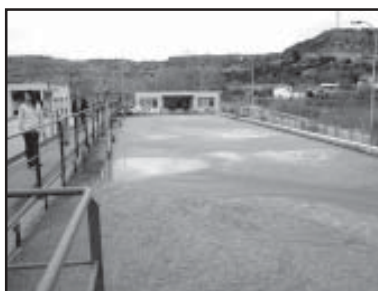
Aguas residuales en fase de depuración

Una vez concluido el período de presentación y estudio de alegaciones, el Ayuntamiento Pleno aprobó definitivamente, en la sesión ordinaria del 1 de marzo, las 7 Ordenanzas de Protección Ambiental aprobadas inicialmente en septiembre de 2001. La normativa entrará en vigor 15 días después de la publicación de la resolución plenaria en el Boletín Oficial de la Provincia de Teruel. Las Ordenanzas, aprobadas por unanimidad consistorial, se dividen en los apartados de Normas Generales y Régimen Sancionador, Re-