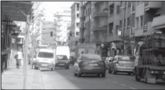
Circulación en la Avenida de Aragón

las grandes ciudades, estamos ante un abandono real en nuestra Ciudad en temas de señalización, circulación, aparcamiento y ordenación del tráfico en general.