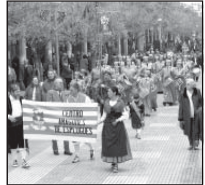
Avance de la Semana Santa, en Esplugues

Como institución miembro de la Ruta del Tambor y del Bombo, el Ayuntamiento está llevando a cabo las actividades de preparación y difusión de los actos que tendrán lugar en Alcañiz a lo largo de la Semana Santa. Entre el 23 de febrero y el 10 de marzo, el Consistorio ha participado en la presentación de la Ruta en Alcora (Castellón), Esplugues de Llobregat (Barcelona) y Mula (Murcia)