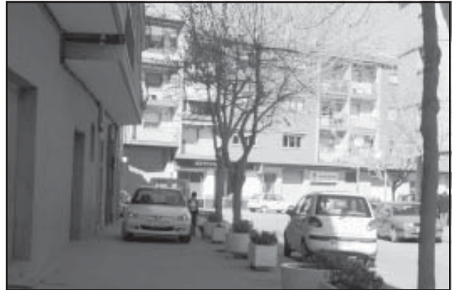
Acera y calzada en la Avenida de Huesca

- Existen calles de doble dirección por las que casi no pueden cruzarse dos coches. Es evidente el peligro que esta realidad causa en muchos de nuestros barrios, máxime cuando hablamos de una ciudad y de unas calles con fuertes pendientes.