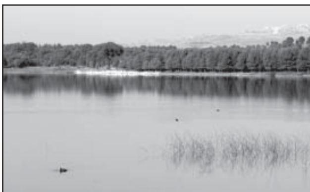
La Estanca de Alcañiz, vista desde su presa

Nos alegró, no obstante, que una moción de las mismas características fuera presentada en las Cortes de Aragón por el PAR un tiempo después, quizás el oportunismo del que se nos acuso había servido para concienciar a algunos de la necesidad de cuidar y respetar nuestros recursos hídricos, quizás era tiempo de olvidar tanto cemento y pensar en limpiar los cauces, potenciar las depuradoras, mejorar los regadíos, proteger los acuíferos, eliminar los vertidos, convencernos de que no existen fronteras que puedan aislarnos de la contaminación y, en definitiva, cumplir uno de los principios básicos en la protección del medio ambiente: pensar en lo global, actuar en lo local.