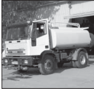
El nuevo camión de baldeo

El camión de baldeo adquirido por el Ayuntamiento a la empresa Ros Roca, por 71.997,93 € ha iniciado el período de pruebas, a cuyo término se determinará la regularidad y zonas en las que se utilizará. Entre sus características destacan 8.000 litros de capacidad de cisterna, 2 boquillas de riego y 2 de baldeo, así como su versatilidad, ya que puede usarse como vehículo contra incendios y para el transporte de agua potable.