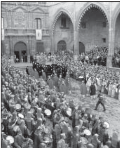
La Plaza de España, escenario destacado