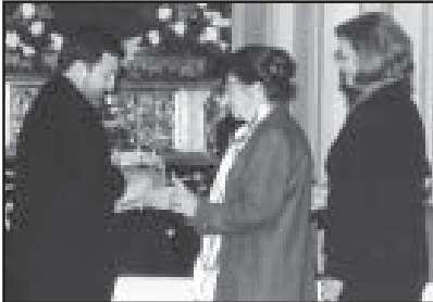
El Tambor Noble, para el Silencio