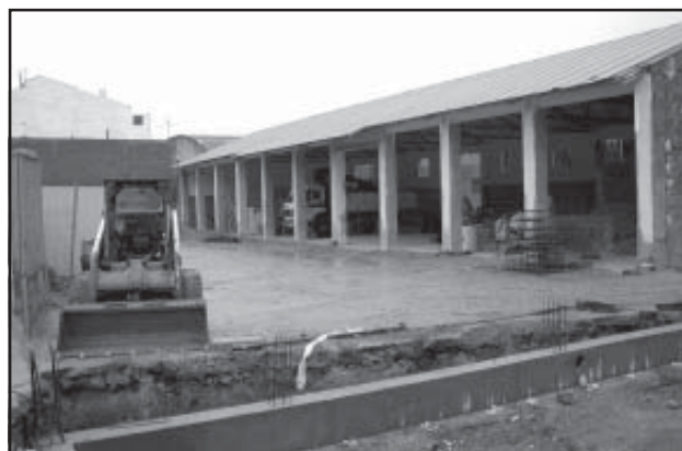
Zona del futuro parque de Bomberos, un cuerpo de protección civil

Con este conjunto de actuaciones, se pretende dar respuesta a situaciones de riesgo, emergencia y catástrofe, además de incidir en la prevención de los mismos, creándose para ello, dentro del Organigrama Municipal, la Delegación de Protección Civil, responsable de la Protección Civil en nuestra localidad.