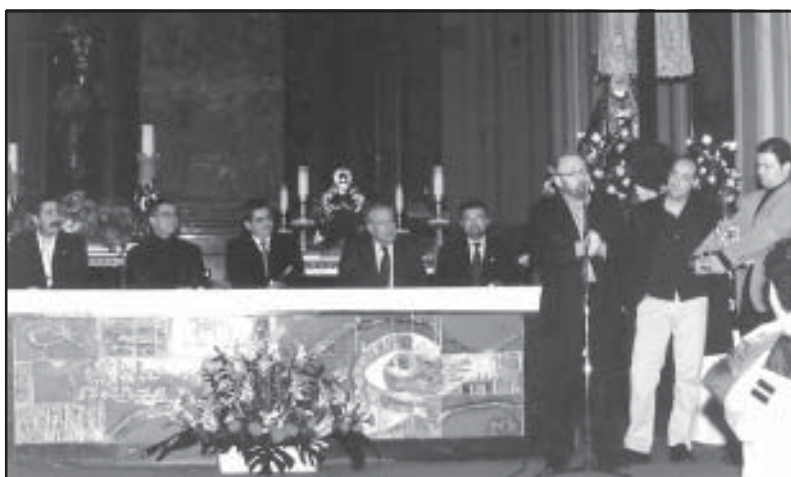
El Pregonero y la Presidencia, durante la concesión del premio Redoble