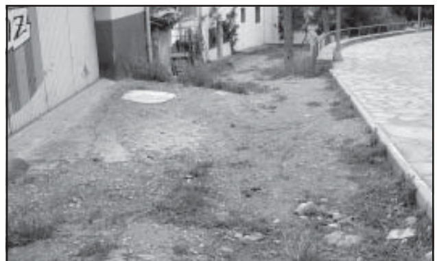
Los jardines de la Ronda Calatravos necesitan reformas

Sabemos que nuestra ciudad necesita muchas otras actuaciones y reformas. Todas y cada una de ellas están en nuestro archivo, y sobre muchas de ellas existen compromisos de mejora que esperamos que el Gobierno cumpla, dando satisfacción a los Ciudadanos, y asumiendo un deber político con quienes le dieron el visto bueno a su presupuesto.