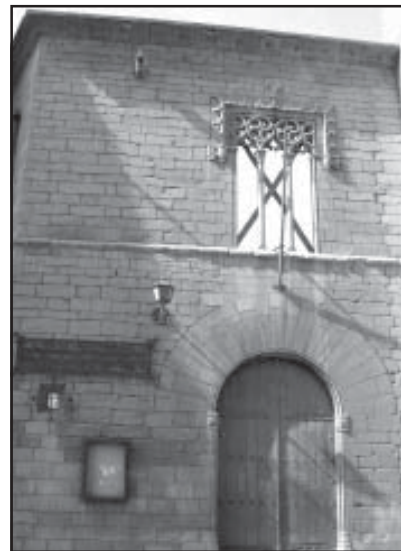
Fachada de la Casa Ardid, en la c/Mayor

La apertura de las ofertas presentadas tendrá lugar el día 24 de abril, en el Despacho B 651 de la dirección reseñada.