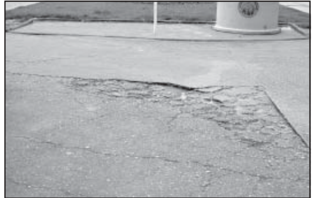
Estado del pavimento en la c/ Belmonte de San José

zonas que perjudican gravemente el tránsito. Queremos terminar con el peligro que entraña la subida y bajada de turismos en la intersección con otras calles. La señalización también es deficiente.