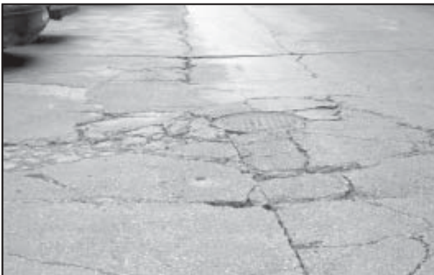
Socavón en la calle Ciudad Deportiva de Santa María

Es comentario unánime que muchas de nuestras calles necesitan desde una reforma integral a un asfaltado urgente. Hay en estos momentos algunas de ellas (véase por ejemplo la calle Ciudad Deportiva de Santa María) que requieren de gran pericia por parte de peatones y de conductores. Lo que antaño fueron baches, hoy son auténticos socavones. Algunas aceras están hundidas o tienen algún agujero. Meter el pie y torcerse un tobillo es más que sencillo. Por esa zona de aceras estrechas, sin bordillos, sin un tráfico ni aparcamiento regulado, el Ayuntamiento no está dando el servicio que el barrio y una Ciudad como la nuestra en su conjunto deberían tener.