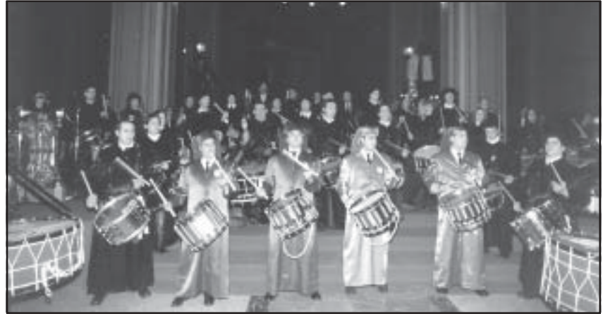
La Excolegiata de Santa María la Mayor acogió numerosos actos