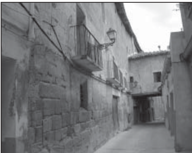
El PP no tiene voluntad de actuar en el Casco Histórico

Casco Histórico: El PP dice que tiene voluntad de actuar en él, incluso regaña a sus vecinos por «falta de fe», pero prefiere gastarse 2 millones de Euros, más de 300 millones de desaparecidas pesetas, en un edificio con 20 aparcamientos, unas pocas y pequeñas oficinas para las Asociaciones y unos espacios para la Casa de la Juventud, que emplear ese dinero en restaurar tres hermosos edificios y situar en ellos los mismos servicios.