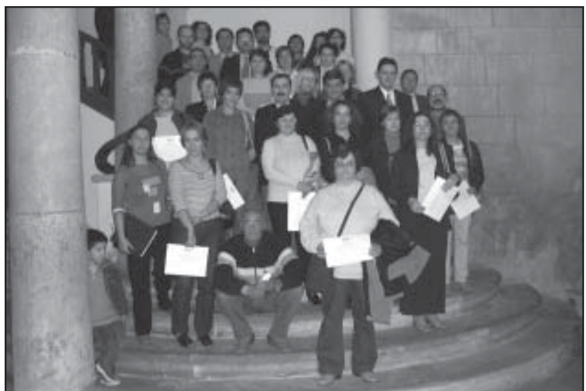
Alumnado, profesores y representantes institucionales tras el acto de clausura

El Taller de Empleo organizado por el Ayuntamiento y subvencionado por el INEM fue clausurado el 31 de octubre. Las alumnas y alum-