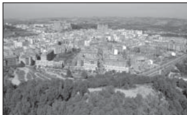
La Reforma favorece la financiación municipal de ciudades como Alcañiz

Otro impuesto modificado es el Impuesto sobre Bienes Inmuebles (IBI) , que se racionaliza al permitir un tratamiento fiscal favorable a los usos residenciales (vivienda) y bonificaciones de hasta un 90% para las familias numerosas. No hay en ningún caso aumento del IBI; ahora bien, se faculta a los municipios a gravar las viviendas desocupadas con un tipo de hasta el 1,65%.