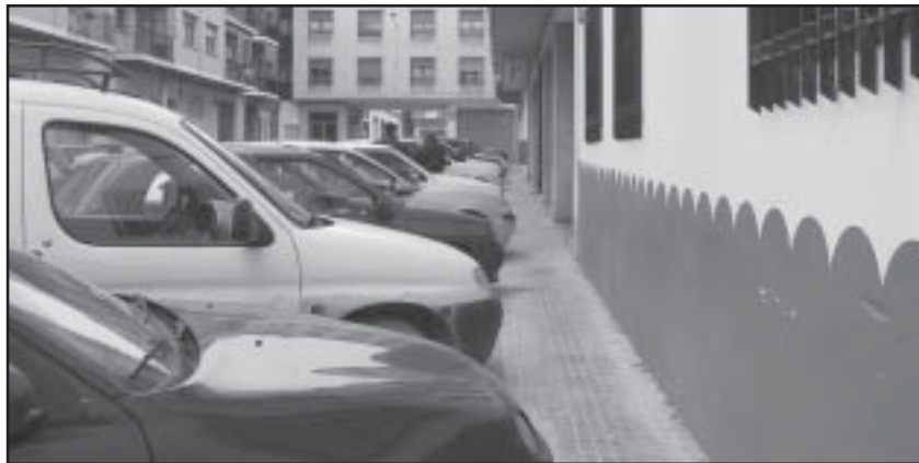
El Proyecto de ejecución prevé ampliar la escasa dimensión de las aceras

La adjudicación de la ejecución a la empresa Aragonesa de Obras Civiles S.L. incluye, entre otros, los requerimientos correspondientes sobre depósito de fianza, aportación de documentos y formalización del oportuno contrato administrativo. El Proyecto Básico y de Ejecución de las obras de accesibilidad prevé reformas en las calles Belmonte de San José, Ciudad Deportiva de Santa María, Avda. Huesca (primer tramo), Comunidad General de Aragón, García Pérez, Pasaje Belmonte de San José, Cantón de Lázaro, Castellote, Torrevelilla y Valdealgorfa, siendo las tres primeras las incluidas en las actuaciones de la Fase I. El plazo de ejecución estimado es de 6 meses, durante los cuales puede haber diferentes restricciones de tráfico en las calles donde se lleven a cabo los trabajos. Según el Proyecto, la actuación pretende subsanar problemas