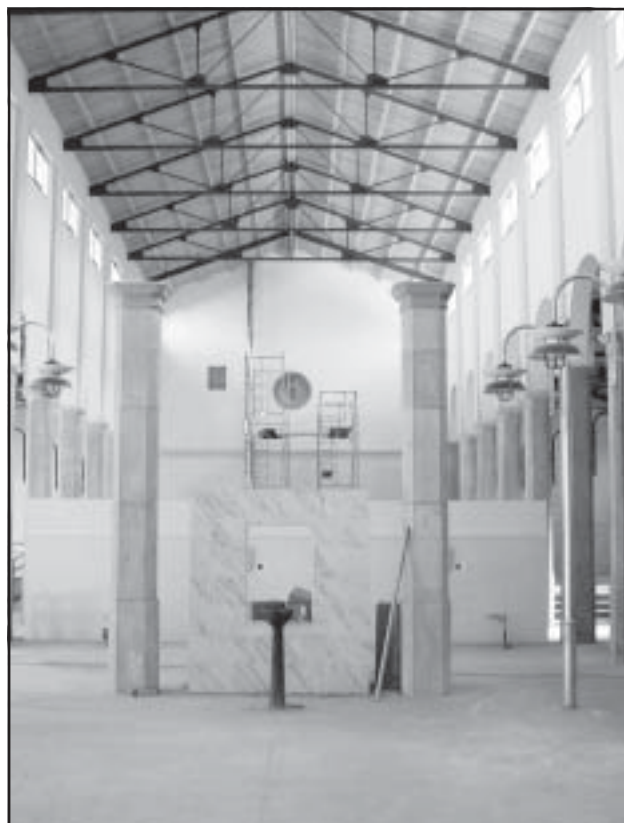
El nuevo Belén se instalará en el remodelado Mercado Municipal

Esperando que estos días de fiesta nos hagan iniciar el año que viene con un entusiasmo renovado, nos encontraremos en el próximo Boletín, donde presentaremos las propuestas contenidas en el presupuesto municipal para el 2003.