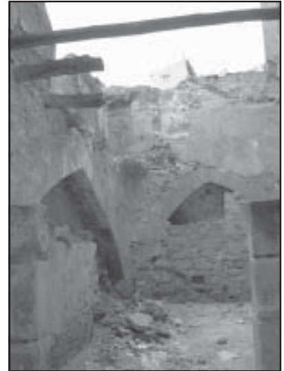
Ejemplo del estado de algunos solares

conseguir que el precio de la vivienda bajase, ha demostrado con hechos contundentes todo lo contrario. El precio de las viviendas sube de una manera, al parecer, imparable y Alcañiz no se ha quedado al margen de esta situación. La excesiva presión del dinero que huye de donde hay poco que ganar, bolsa, fondos, etc. los bajos intereses y grandes plazos hipotecarios, y sobre todo el interés que tiene el Gobierno en