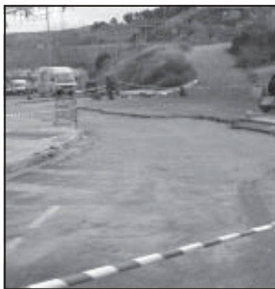
La reparación de blandones, prevista

El Proyecto Técnico y el Estudio Básico de Seguridad y Salud relativo a esta adjudicación, tiene como objeto básicamente la reparación de blandones mediante reposición de pavimento y desagüe de diversas zonas de la Ronda de Caspe, actuando en una superficie de 807 metros cuadrados separada en tres