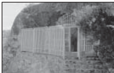
Cerramiento actual del abrigo

“El acceso al abrigo pintado puede realizarse a través de caminos en buen estado que parten desde Alcañiz (a 17 km. distancia) o desde Valdealgorfa (a 12 kms.). El abrigo de Val del Charco del Agua Amarga se localiza en la Val del mismo nombre, en la margen derecha del río Guadalupe, del que se sitúa a unos 3 kms. de distancia. El abrigo se emplaza en un gran bloque rocoso orientado a poniente. Aparece formado por una concavidad en cuyas paredes los hombres que habitaban este sector del Bajo Aragón hace varios milenios pintaron una serie de figuras y escenas de gran interés. Este abrigo constituye uno de los más importantes del arte rupestre levantino de la península ibérica, aunque su conservación en general es bastante deficiente. El panel pintado mide 6,80 m. de largo por 1,70 m. de alto, aprox. y contiene cerca de 80 figuras, todas ellas pintadas en rojo aunque con diversos matices. Si describimos el friso pintado de izquierda a derecha, en primer lugar, encontramos una cacería de cabras, en la que tres de estos animales corren hacia la izquierda del observador acosados por otros tantos hombres, con arcos, en posturas distintas y diversos tocados de plumas. En la escena se encuentra también una bella cabra de factura distinta, con un delicado perfil de trazo grueso y modelado relleno de color en la cabeza, cuello y pecho. Un poco más a la derecha aparece un gran arquero, de 0,21 m. de altura que lle-