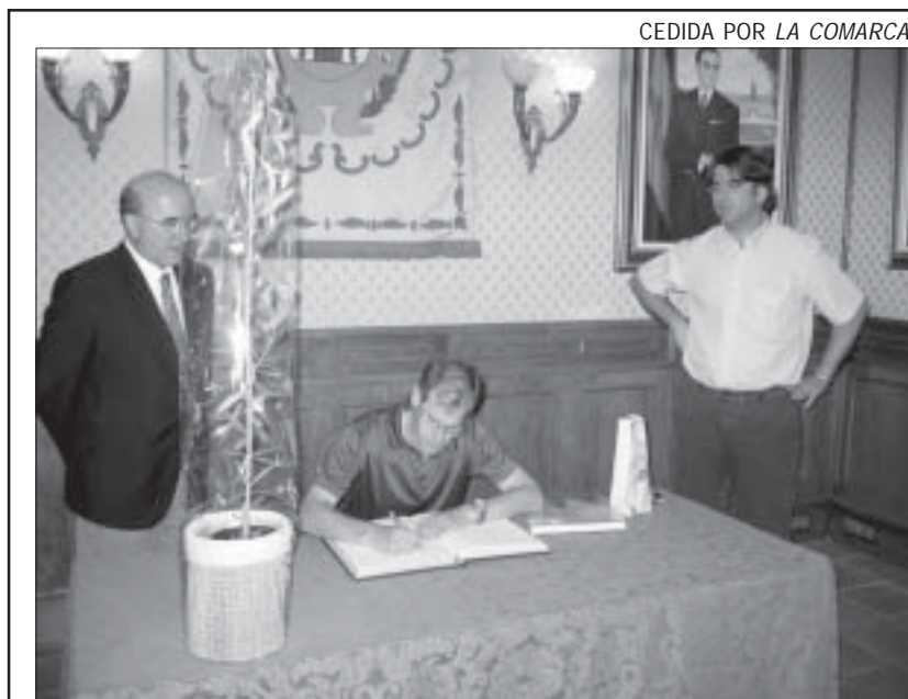
CEDIDA POR LA COMARCA

- Venta de parcela sobrante, terreno municipal en Pº Andrade nº 2, vista la propuesta de Alcaldía de 3 de junio, que incluye “enajenar a Promociones Jomaeva S.L. la parcela municipal sita en Paseo Andrade nº 2 por el precio de 24.589,84 €, impuestos no incluidos (...). De acuerdo con propuesta de Comisión de Urbanismo (1/06/04), el producto obtenido de esta venta se destinará a las obras de ampliación del cementerio, concretamente, construcción de nichos”.